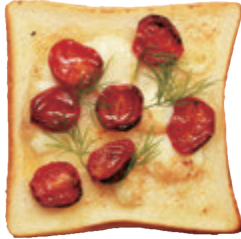
セミドライトマトとタレージョ ¥600