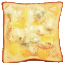
クアトロフォルマッジ ¥700

フレッシュなバナナと自家製のローストナッツにたっぷりのチョコレートシロップをかけました。