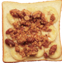
バナナとハニーローストナッツ ¥500

フレッシュなバナナと、自家製のハニーローストナッツを合わせたデザートトーストです。