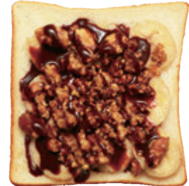
チョコ & バナナ ¥500

フレッシュなバナナと、自家製のハニーローストナッツを合わせたデザートトーストです。