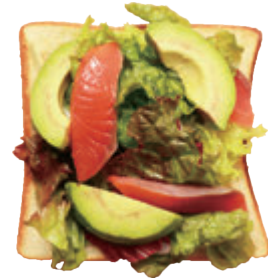
サーモンとアボカドのサラダトースト ¥700