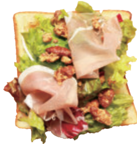
生ハムとローストナッツのサラダトースト ¥650